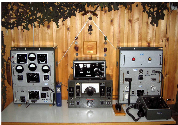
Armeijakunnan radioasema toimintakunnossa

Tämän jälkeen lähetin varustettiin Collisin valmistamalla VFO:lla ja tarjottiin puolustusvoimille. Puolustusvoimat hyväksyi lähettimen armeijakunnan radioaseman lähettimeksi. AK:n radioasema muodostui VR7 lähettimestä ja vastaanottimena toimi ASA Radio OY:n valmistama liikennevastaanotin VRLK.