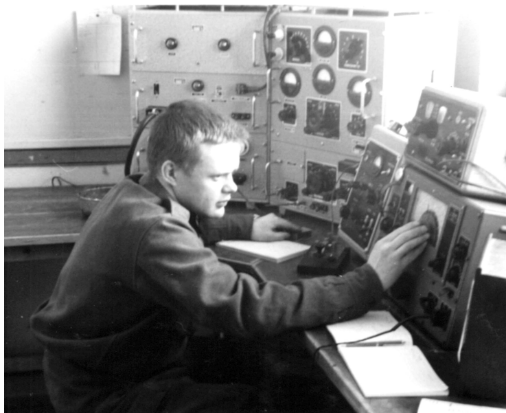
Kuva mestariluokan tutkinnosta 1964

Maavoimien lisäksi VR7 käytti ilmavoimat sekä laivasto omiin tarkoituksiinsa. 1960-luvulla mestariluokan radioviestittäjän tutkinto suoritettiin VR7 / VRLK yhdistelmällä.